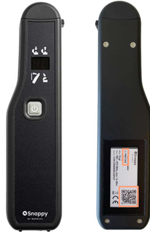
QR-koodi ja sarjanumero löytyvät laitteen takaa